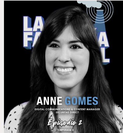
Episodio 2 (T4): Securitas Direct, caminando con seguridad por LinkedIn